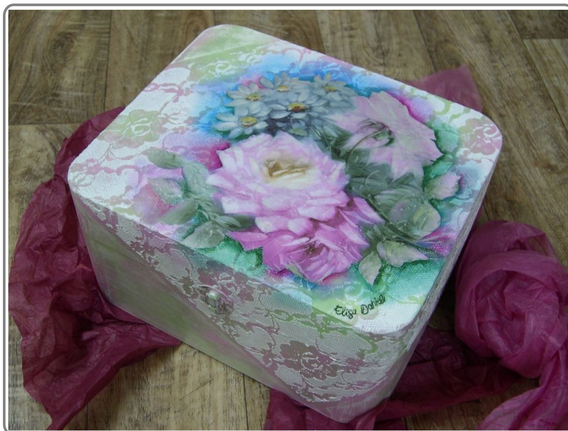
Esempio di realizzazione finale