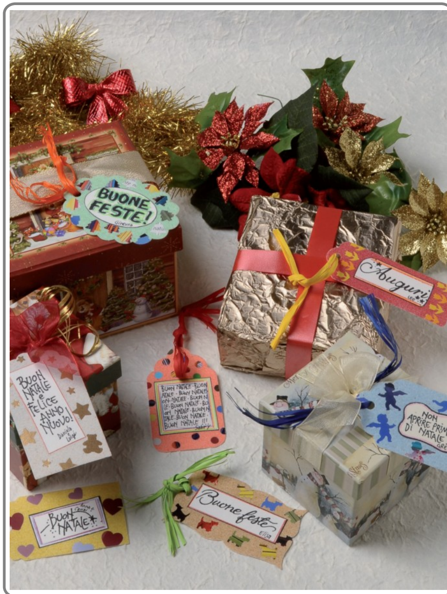
Esempio di realizzazione finale